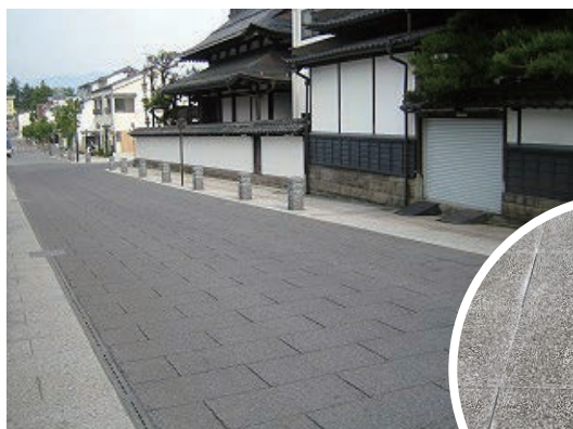
長野県善光寺周辺