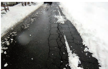
ひび割れ・穴ボコが