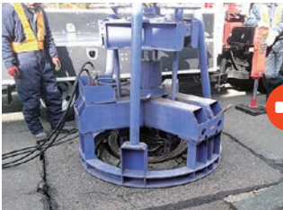
マンホールリムーバー によるせん断