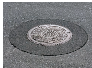
一関市 (施工後1年経過)