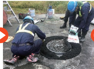
MR2ハイブリッド敷均し