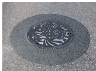
釜石市 (施工後2年経過)