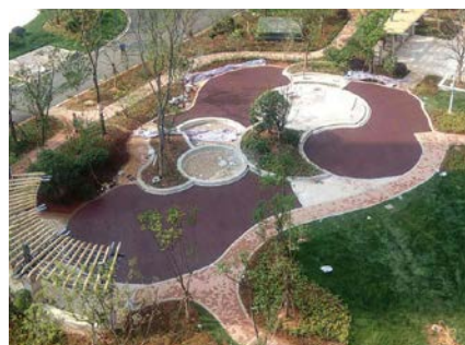
中華人民共和国上海での施工事例