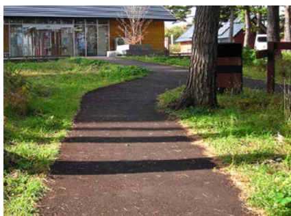
大船渡市基石海岸 (平成26年度9月施工、約4年経過)