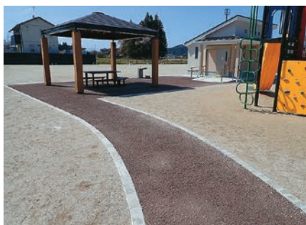
一関市 (平成30年度8月施工、約8ヶ月経過)

国立公園 史跡 神社仏閣 公園園路 遊歩道 サイクリングロード ジョギングロード など